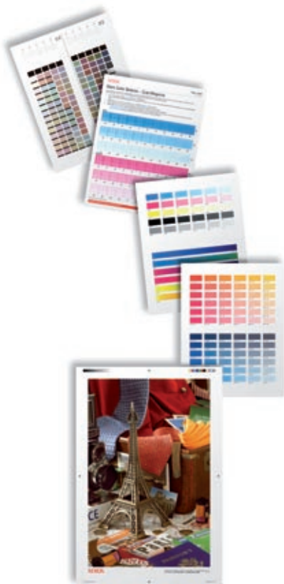
Las herramientas incorporadas de calibración del color le brindan el resultado final que usted desea.

Es por esta razón que la impresora color Xerox Phaser 7760 es la elección de los diseñadores. Ofrece colores brillantes, velocidades impresionantes y funciones fáciles de usar para que pueda sacarle el mayor provecho a todo lo que imprima.